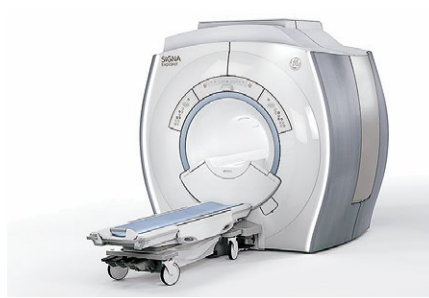
1.5T MRI (磁気共鳴断層撮影) 装置 GEヘルスケア・ジャパン Signa explorer 1.5T