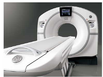
64列マルチスライスCT装置 GEヘルスケア・ジャパン Revolution EVO EX