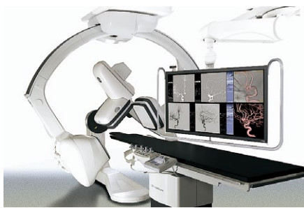
脳血管撮影装置 GEヘルスケア・ジャパン INNOVA IGS6 630