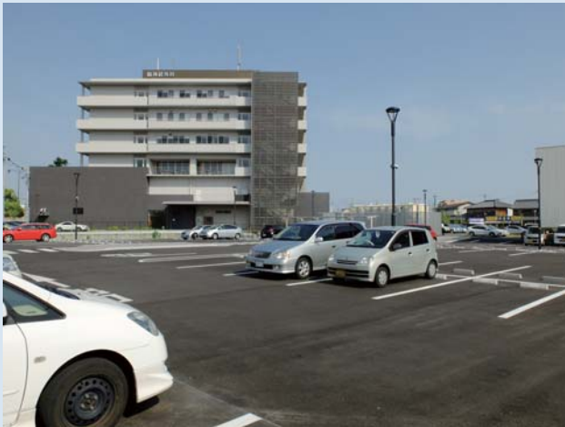
順心病院西側より撮影

このように医療界は大きな転換期を迎えようとしており、急性期医療から在宅介護まで、それぞれに対応した医療、福祉のセーフティネットを構築する必要に迫られています。これから、今までの皆様との取り組みをさらに充実させるとともに、連携をさらに深め、選ばれるサービスを提供し続けることができるよう努力してまいりますので、引き続きご指導ご鞭撻よろしくお願いたします。