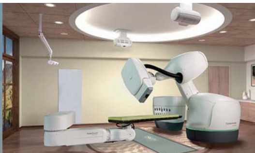
兵庫県・大阪府・岡山県におけるサイバーナイフの設置状況