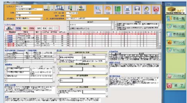
レジメン管理システム

副作用の確認や自己管理の指導を行なうことにより患者様の治療に対する不安の軽減にも努めています。