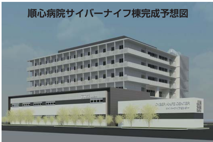
順心病院サイバーナイフ棟完成予想図