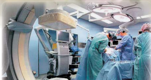
「サンデー毎日 平成26年10月26日号」 「後悔しない病院選び（脳梗塞）」で治療実績ランキング1位の病院として取材記事が掲載されました。

広報紙『きずな』へのご希望・ご意見を http://www.junshin.or.jp/ または F a xでお寄せ下さい。