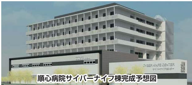
順心病院サイバーナイフ棟完成予想図

サイバーナイフとは「放射線治療ロボット」のことです。治療台に寝ているだけで、あとはロボットが自動的に放射線照射を行っていきます。実際にメスを使って体を傷つけるのではなく、患部に放射線を正確に照射し、まるでメスで切り取ったように病変をとるもので、痛くも熱くもなく、麻酔の必要もありません。対象疾患は、主に脳腫瘍で、腫瘍の大きさによって異なりますが、1回の治療時間は治療室に入ってから終了するまで20~30分です。