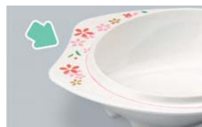
フチが幅広く手を添えて持ちやすくなっています