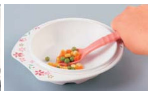
深底で片手でもすくいやすくなっています