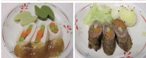
ソフト食 鶏肉のアスパラ巻き煮