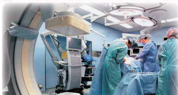
日経実力病院調査(2013年度版)で「脳卒中治療、 ワンストップで」でハイブリッド手術室など機能集約 が紹介されました。

広報紙『きずな』へのご希望・ご意見を http://www.junshin.or.jp/ または F a xでお寄せ下さい。