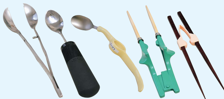
図2 食事に関わる自助具（一部）